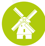
Schéma de valorisation du patrimoine à l'échelle d'une communauté de communes

Diffusion culturelle dans les communes rurales